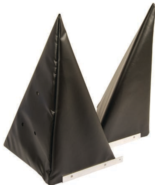
Hoekafdichting ES (driehoek)