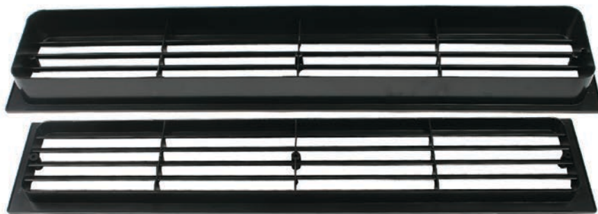
De niet-afsluitbare "P" ventilator