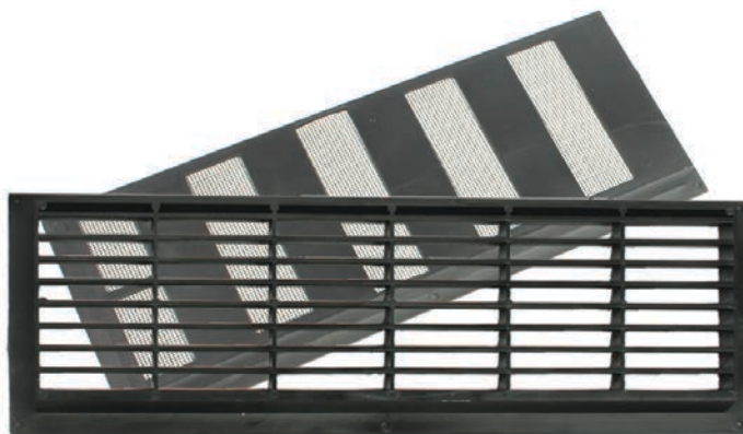
De afsluitbare ventilator